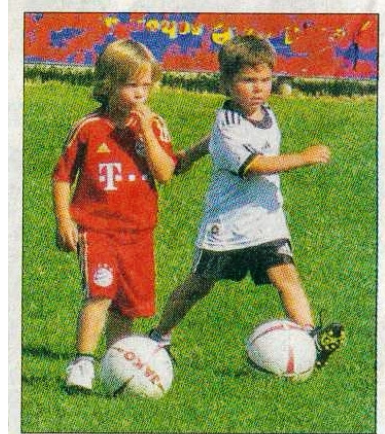
Bei der Talentsichtung morgen im Rheinstadion sind vor allem die Jahrgänge 1998 bis 2004 bei den Buben und Mädchen angesprochen.